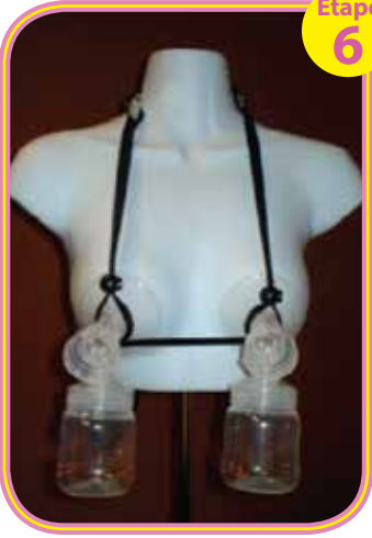
Simplicité™ Entièrement Assemblé

6. Positionner les boucliers de la pompe du sein sur vos mamelons. Vous devrez peut-être glisser la courroie de pompage le long de la sangle de taille pour ajuster la position. Vous pouvez aussi avoir besoin de réajuster la longueur de la sangle de pompage en utilisant la pince à ressort du cou. Prenez soin de régler la longueur et la position des sangles avec soin pour adapter à votre corps. Une fois que vous obtenez la bonne, vous ne devrez jamais régler les sangles à nouveau.